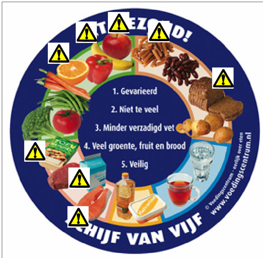
Figuur 2 De 'Schijf van vijf' met aanbevolen voedingsmiddelen, met daaraan toegevoegd een aanduiding welke van deze voedingsmiddelen belangrijke allergenen kunnen bevatten.